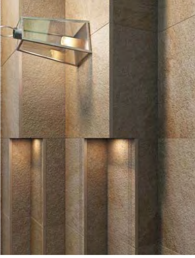
BERGEN FIAMMATA RETT. | ➔ 20mm | 60x60cm / 24"x24" - Fiammata surface p. 104

Gradone bordo inciso con gocciolatoio 30x60cm / Step tread with grooves and flap 12"x24"