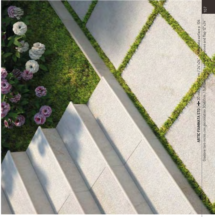
ARTIC FIAMMATA STD. | ➔ 20 mm | 60x60 cm / 24"x24" - Fiammata surface p. 104

Gradone bordo inciso con gocciolatoio 30x60cm / Step tread with grooves and flap 12"x24"