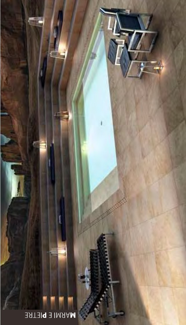
BERGEN FIAMMATA RETT. | ➔ 20mm | 60x60cm / 24"x24" - Fiammata surface p. 104

Gradone bordo - Elemento griglia 15x60cm / Step tread 12"x24" - Grill component 6"x24"