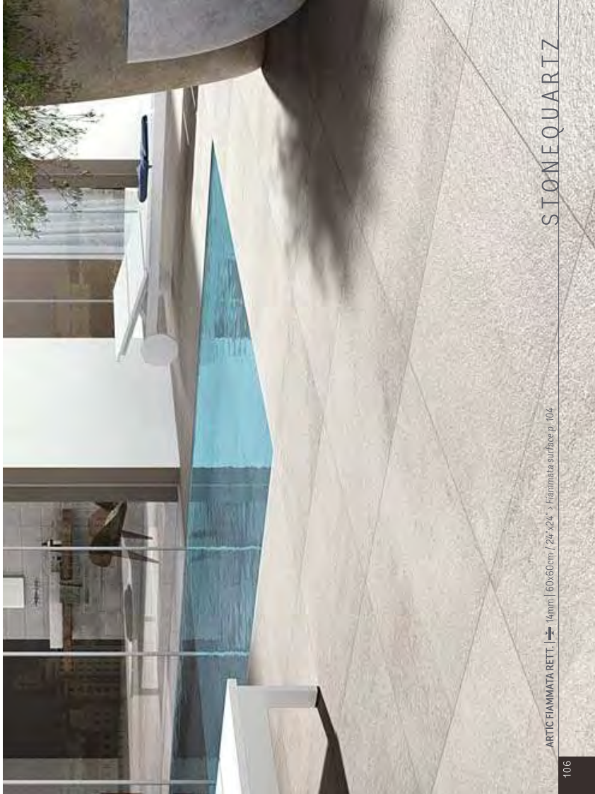
ARTIC FIAMMATA RETT. | ➔ 14mm | 60x60cm / 24"x24" - Fiammata surface p. 104

Gradone bordo - Elemento griglia 15x60cm / Step tread 12"x24" - Grill component 6"x24"